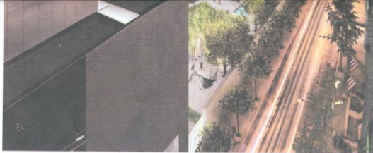
Het Museum of Modern Art in New York zoals het er na de verbouwing zal uitzien.

Terrence Riley, de curator voor architectuur en design legt uit waar het museum bewust naar heeft gezocht. "Wat je denkt dat je wilt, blijkt soms in de praktijk niet te werken. Omdat ons oude gebouw zo krap was, wilden we erg graag heel hoge muren en heel veel skylights. Dat was uiteindelijk teveel van het goede, want nu hebben we ruimte zat. We wilden vooral dat de ruimtes goed bruikbaar waren; geen doodlopende gangen, vreemde hoekjes of ruimtes die een opgesloten gevoel geven. Vroeger waren onze tentoonstelling heel lineair -